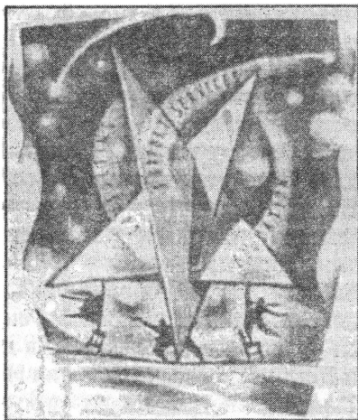
Эмблема фирмы "Оракл" (Русь Православная. 2001. № 1. С. 7)

Руководство МП не заступилось за русский народ и в связи с нивелирующей отменой графы "национальность" в паспортах, вместо чего предусмотрена кодификация граждан по "международным стандартам" Нового мирового порядка. Думается, не случайно и демонстративное использование в новых паспортах трех шестерок для обрамления номеров страниц – "Бог шельму метит". (Отметим также, что Компания "Оракл", привлеченная к проекту "Карточка москвича", имеет в своей заставке в интернете перевернутую пентаграмму на фоне трех вихреобразных шестерок с приветствующими ее внизу человеческими фигурками.)